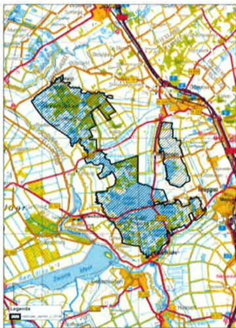
Huidige begrenzing NPWW